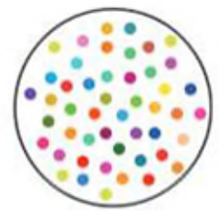
teaching to diversity